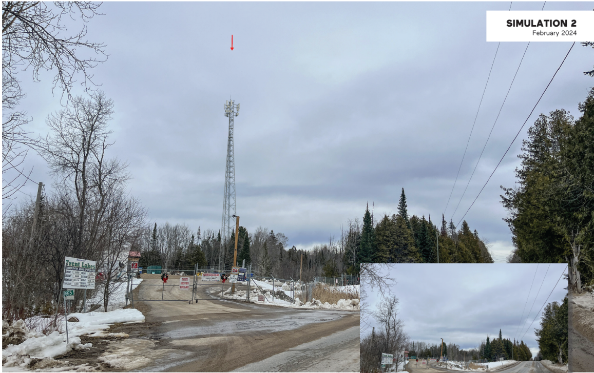
C8592 ALLENS ALLEY & CRYSTAL LAKE RD. APPROXIMATE DISTANCE BETWEEN THE PROPOSED INSTALLATION AND THE VIEWPOINT : 182 METRES