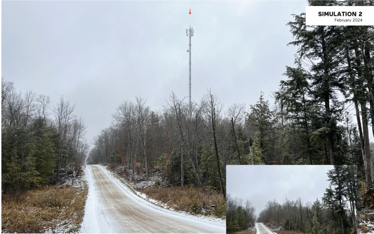
C8593 FIRE ROUTE 348 AND SOUTH SALMON LAKE ROAD APPROXIMATE DISTANCE BETWEEN THE PROPOSED INSTALLATION AND THE VIEWPOINT : 922 METRES